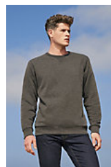
SOL'S SULLY 02990